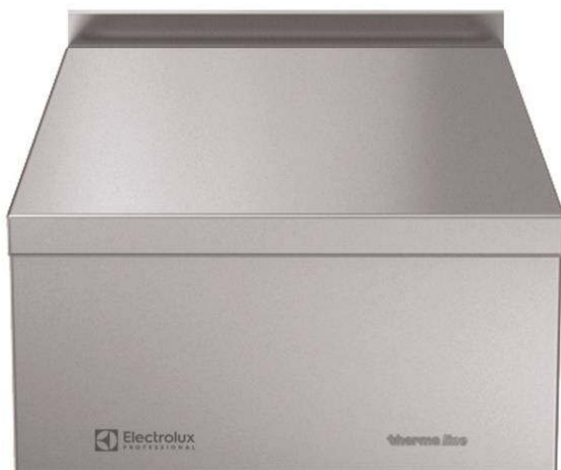
588564 (MBNABBE000) thermaline 85 - 500 mm CLOSED WORK TOP, 1SIDE OPERATION WITH BACKSPLASH